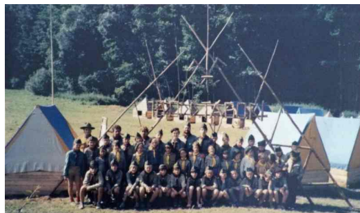
Jedna z historických fotek se zvláštním významem. Víte, co připomíná a kde byla k vidění?

Potvrzení o bezinfekčnosti se odevzdá přímo v den odjezdu. Raději stahujte vzor prohlášení až těsně před vyplněním, situaci sledujeme a aktualizujeme formulář. Zvláštní pozornost věnujte příznakům covidu.